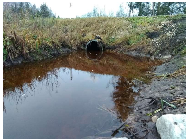
Foto 35. vaade eesvoolul paikneva 14146 Vägeva-Pedja kõrvalmaantee truubile, selle sissevoolu ava poolt