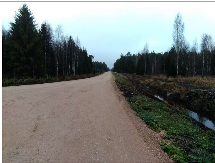
Foto 52. vaade rekonstrueeritud Lasinurme teele PK 13, teekraavile 1001, vahetule enne rekonstrueeritud truupi T15