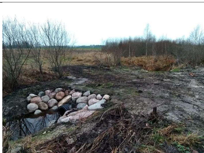
Foto 83. vaade eesvoolul 500 ehitatud uue truubi T507 sissevoolul kividega kindlustatud otsakule ja muldele