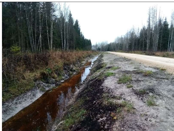
Foto 41. vaade rekonstrueeritud eesvoolu 400 voolusängile ja Lasinurme tee, kus PK 4 ja PK 5 vahel on tekkinud voolusängis vasaku kalda poolel nõlvajalamil erosiooni alged