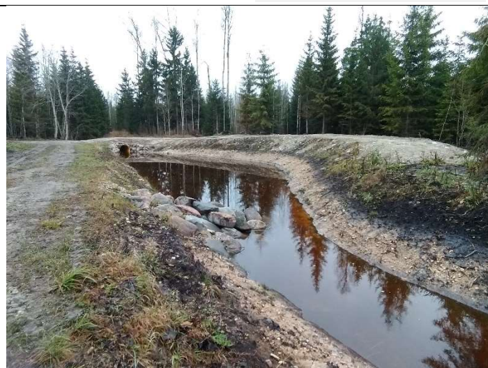
Foto 20. vaade eesvoolul 300 rajatud settebasseinile SB3, selle alguses on tehtud kividega voolusuunaja