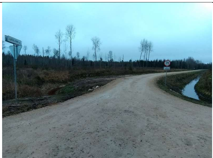
Foto 36. vaade 14146 Vägeva-Pedja kõrvalmaanteelt, rekonstrueeritud Lasinurme tee mahasõidukohale ja liiklusmärkidele, sh tee nimetusega tahvlile