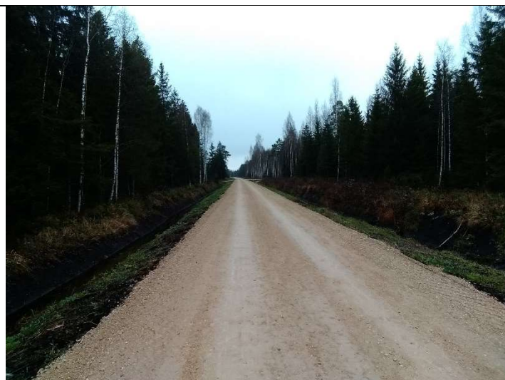
Foto 63. vaade rekonstrueeritud Lasinurme teele PK-st 15 PK16 suunas ja sellega külgnivatele rekonstrueeritud teekraavile 1002 (vasakul) ja eesvoolule 400 (paremal)