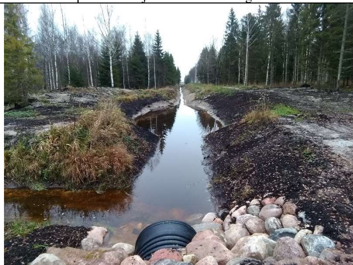
Foto 43. vaade vastu vee voolusuunda rekonstrueeritud eesvoolu 200a voolusängile, settebasseinile SB1, ehitatud uue truubi T401 väljavoolu otsaku poolt