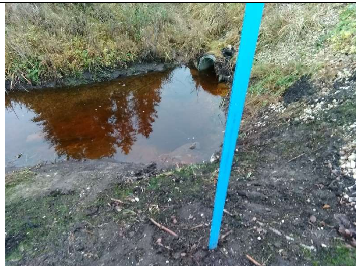
Foto 38. vaade Vägeva-Pedaja kõrvalmaantee ja Lasinurme tee truubi T10 vahel eesvoolu 400 paremalt kaldalt suubuva võimaliku teedreeni suudme asukohale