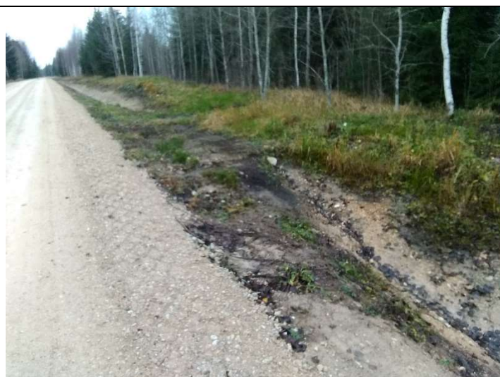
Foto 15. vaade teekraavide 1104 ja 1105 ülemiste otsade vahel kõrgema maapinnaga alal jäetud ca 8m pikkusele katkestuskohale