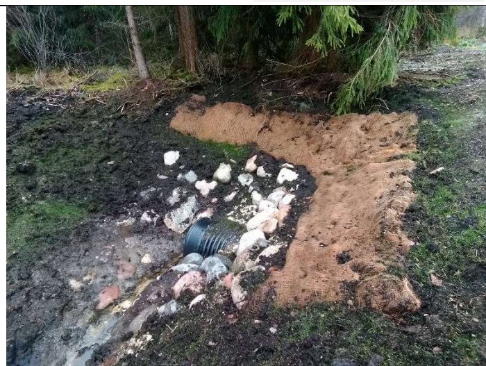
Foto 30. vaade Soemäe ringtee teekraavi 1106 liigvee ära juhtimiseks eesvoolu 100, rekonstrueeritud truubi T7 sissevoolu otsakule