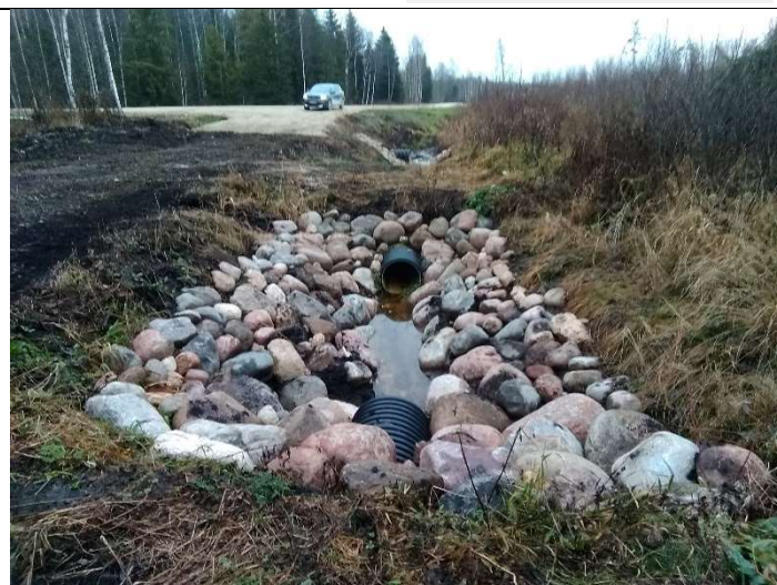
Foto 70. vaade kraavil 503 (Kundaraja kraav) ehitatud truupide T506a ja T506 vahel kividega kindlustatud voolusängile ja otsakutele