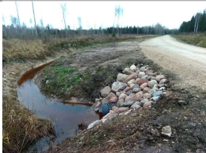
Foto 39. vaade vastu vee volusuunda rekonstrueeritud teekraavile 1001, truubi T10 sissevoolu otsaku poolt