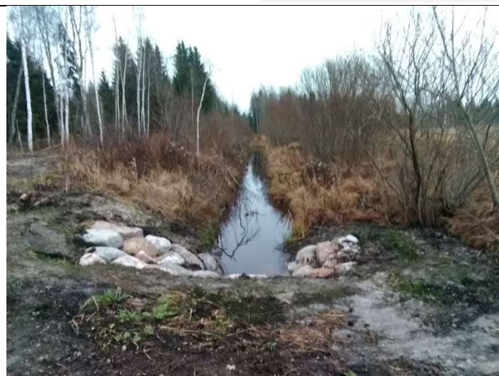
Foto 82. vaade vastu vee voolusuunda hooldatud eesvoolu 500 voolusängile, ehitatud uue truubi T507 sissevoolul kividega kindlustatud otsakult