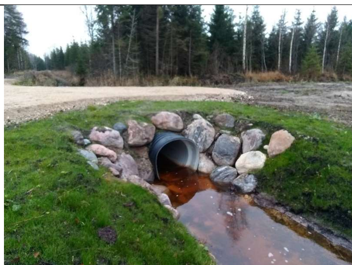
Foto 17. vaade rekonstrueeritud truubi T6 sissevoolu poolsele kividega kindlustatud otsakule