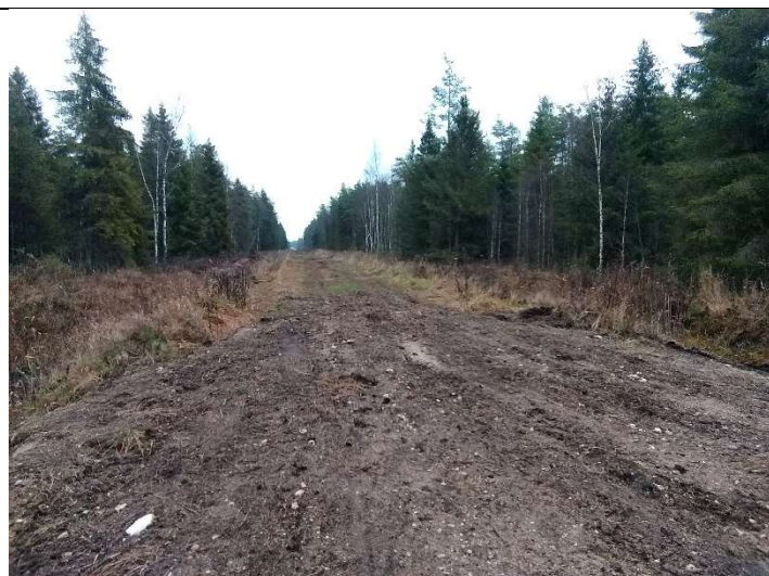
Foto 79. vaade uuendatud eesvoolu 600b ja olemasolevasse seisukorda jäänud kraavi 1212 vahelisel alal tasandatud muldele