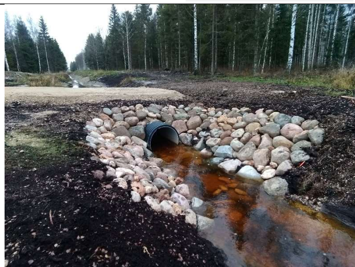
Foto 42. vaade rekonstrueeritud eesvoolul 200a ehitatud uue truubi T401 väljavoolul kividega kindlustatud otsakule