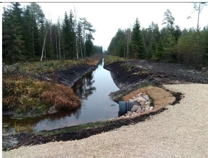
Foto 56. vaade rekonstrueeritud eesvoolu 200b voolusängile ja ehitatud settebasseinile SB2 ning ehitatud truubi T1002 sissevoolu poolsele otsakule