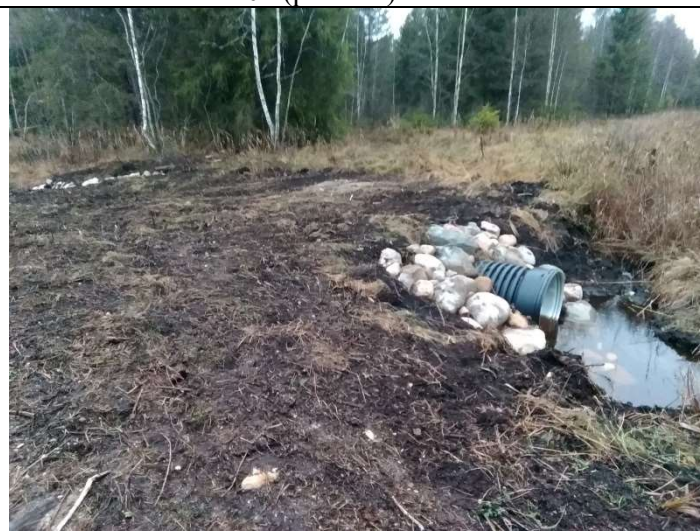
Foto 76. vaade rekonstrueeritud truubi T29 sissevoolu otsaku poolt