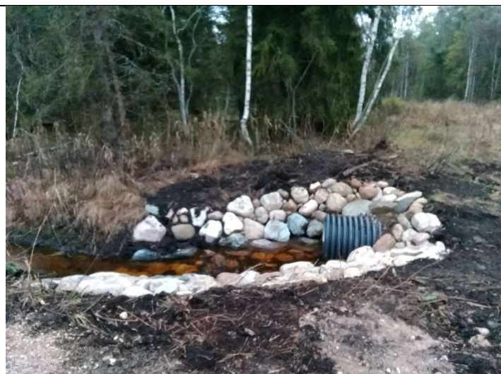
Foto 77. vaade rekonstrueeritud truubi T29 väljavoolu otsaku poolt