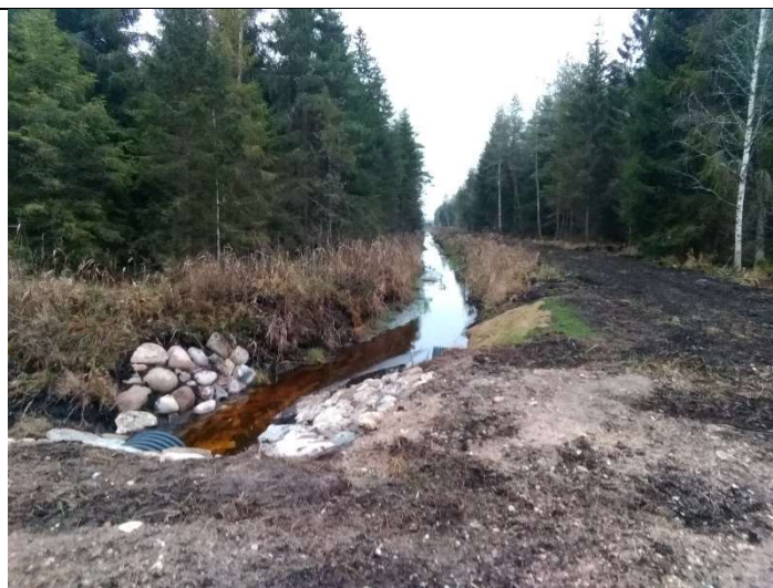
Foto 80. vaade uuendatud eesvoolu 600d voolusängile, rekonstrueeritud truubi T31 väljavoolu otsaku poolt