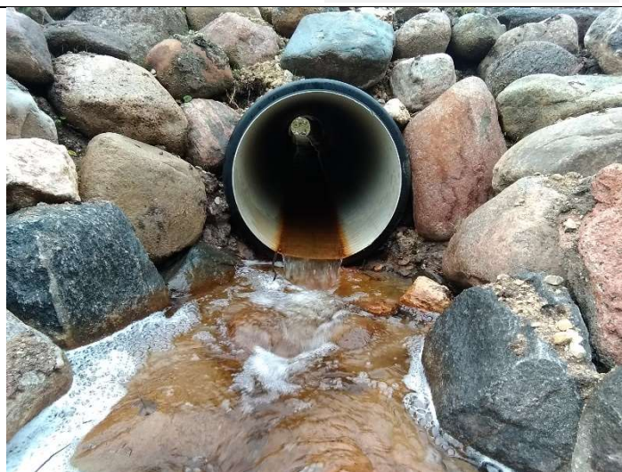
Foto 14. vaade rekonstrueeritud truubi T3 plasttorustikku, selle väljavoolu ava poolt