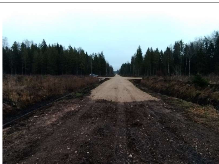
Foto 75. vaade ehitatud Jaama tee lõpust, kus on sõidukite tagasipööramiskoha TP-T vasakpoolse haara lõpus tehtud teekatendi ja trassi tasandatud muldele sujuv üleminek