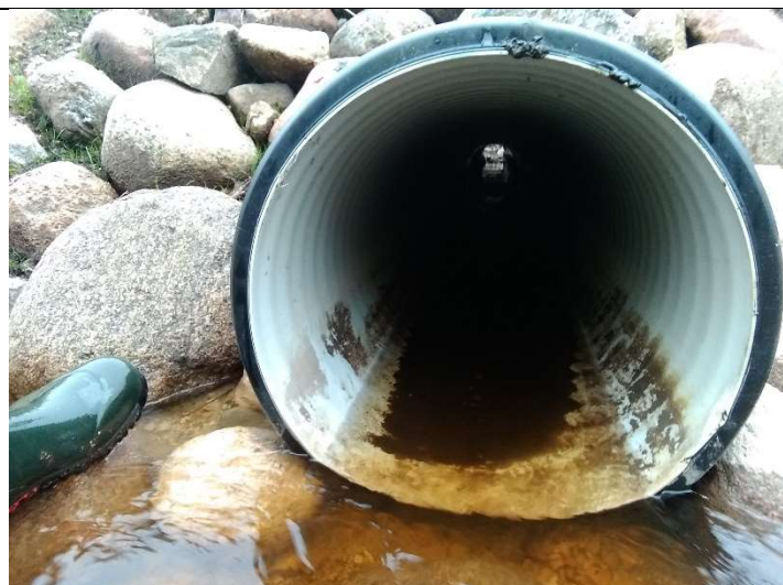
Foto 29. vaade rekonstrueeritud truubi T7 plasttorustikku, selle väljavoolu ava poolt