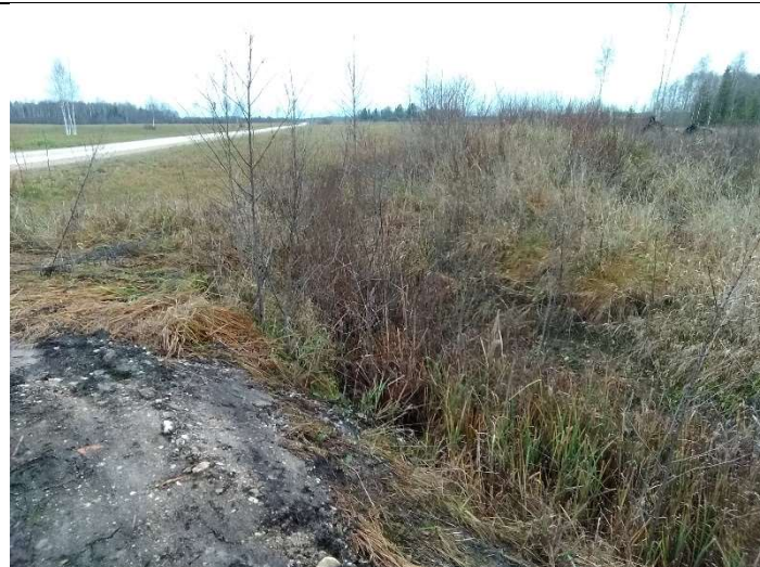
Foto 40. vaade teekraavi 1001 paremalt kaldalt suubuvale rohtunud ja võsastunud põllukraavile