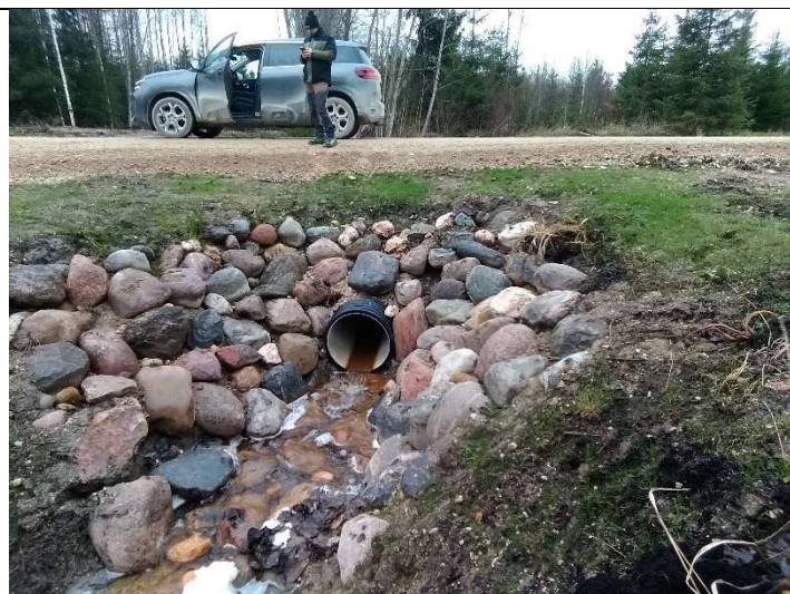
Foto 13. vaade rekonstrueeritud truubi T3 väljavoolul kividega kindlustatud otsakule