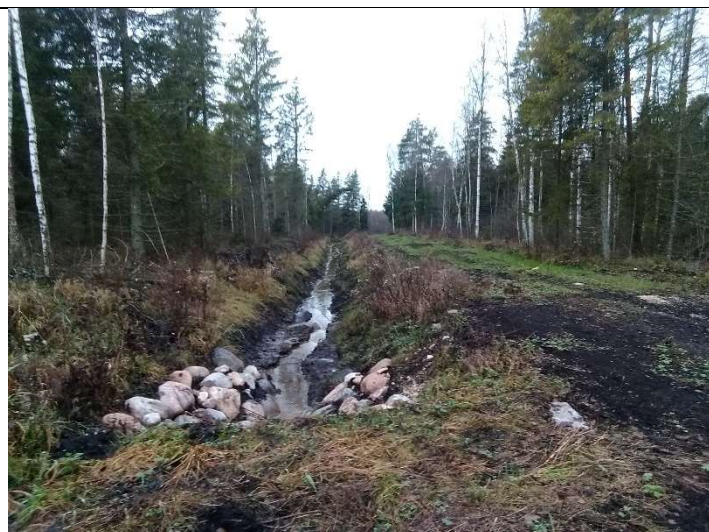
Foto 71. vaade rekonstrueeritud kraavile 503, truubi T506a allavoolu