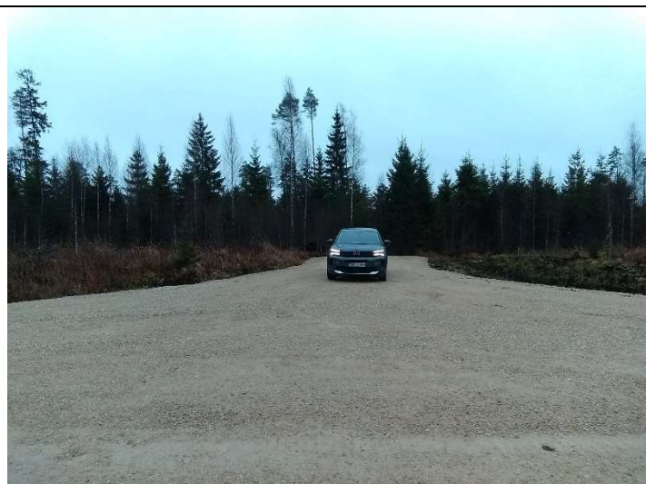
Foto 31. vaade rekonstrueeritud Soemäe ringtee PK 21 läheduses rekonstrueeritud mahasõidukohale M1