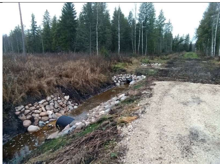
Foto 69. vaade rekonstrueeritud kraavil 503 (Kundaraja kraav) rekonstrueeritud T18 ja ehitatud truupidele T506 ja T506a kividega kindlustatud otsakutele