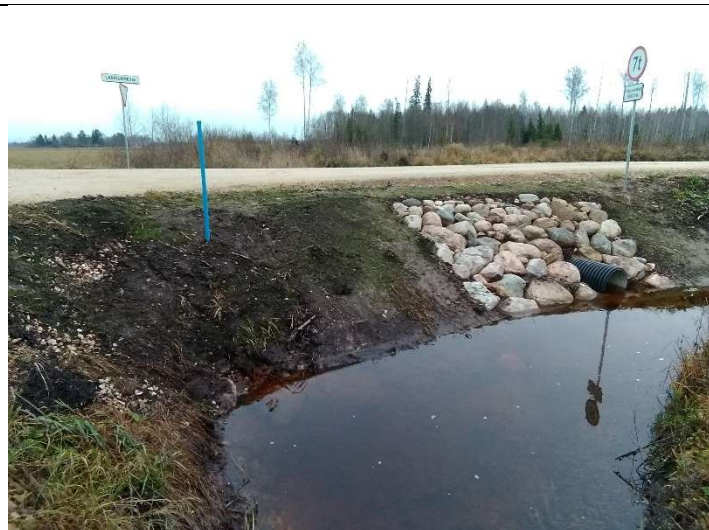
Foto 37. vaade rekonstrueeritud Lasinurme tee alguses, sinise plasttoruga tähistatud võimaliku teedreeni asukohale rekonstrueeritud truubi T10 väljavoolu poolsele kividega kindlustatud otsakule