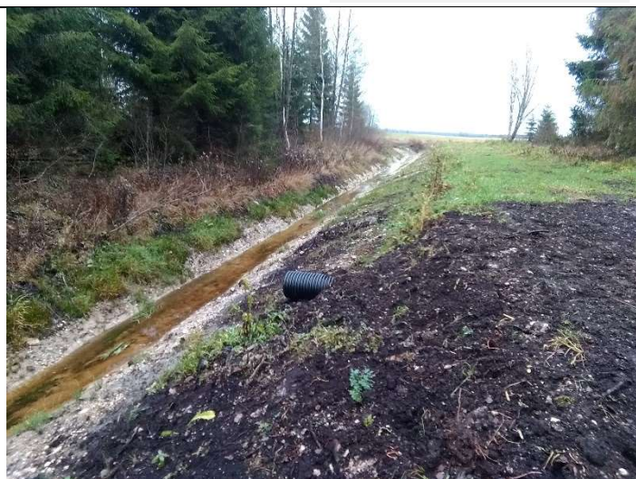
Foto 46. vaade rekonstrueeritud eesvoolu 200a voolusängile ja selle PK5 ja PK6 vahelisel lõigul rajatud veeviimari väljavoolu poolsele otsakule