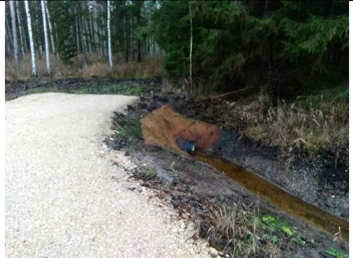
Foto 6. vaade rekonstrueeritud truubi T1 sissevoolu poolsele erosioonitõkkematiga kindlustatud otsakule