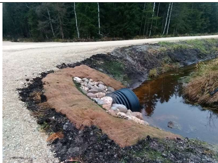
Foto 57. vaade ehitatud truubi T1002 erosioonitõkke mati ja kividega kindlustatud sissevoolu poolsele otsakule