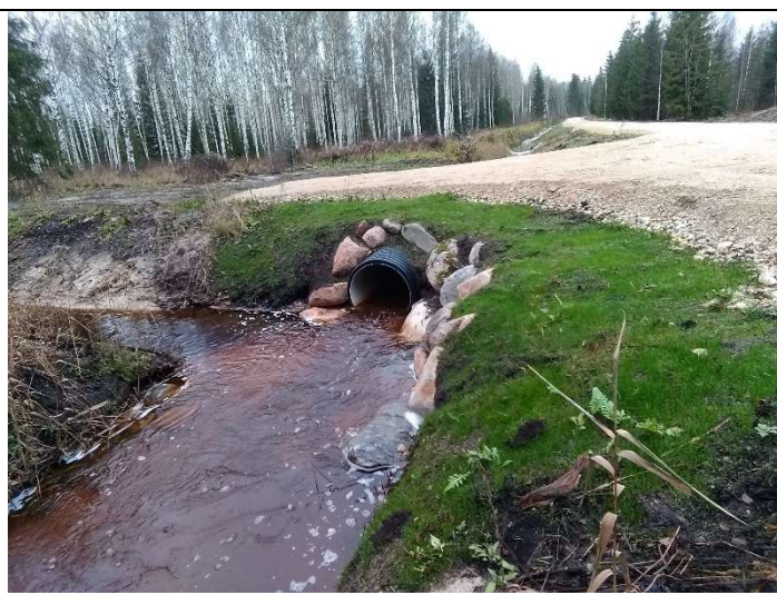
Foto 16. vaade eesvoolul 100 rekonstrueeritud truubi T6 väljavoolul kividega kindlustatud otsakule