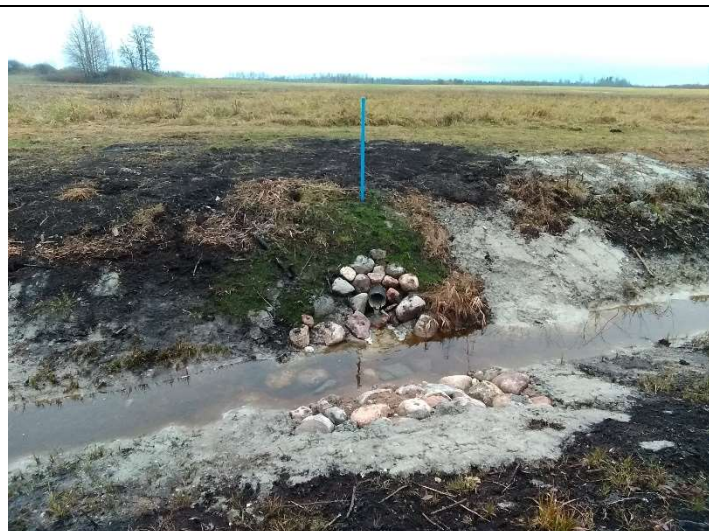
Foto 51. vaade eesvoolu 202a paremalt kaldalt suubuvale, rekonstrueeritud drenaažisuudmele D1 ja selle tähisele