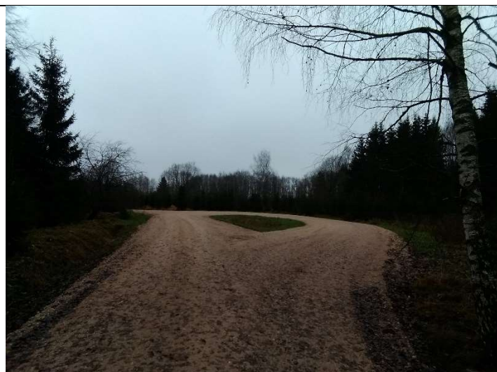
Foto 73. vaade rekonstrueeritud Lasinurme tee lõpus sõidukite tagasipööramis kohale