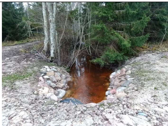
Foto 23. vaade eesvoolu 300 voolusängile ehitatud truubi T305 allavoolu