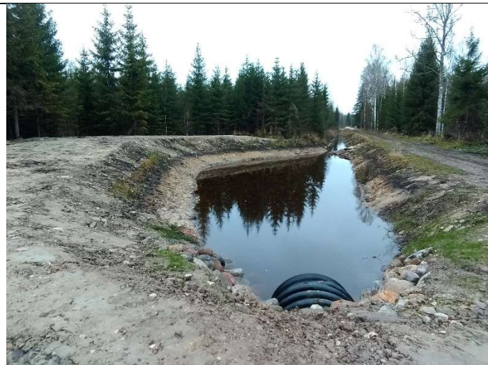
Foto 22. vaade eesvoolul 300 rajatud settebasseinile truubi T305 sissevoolu otsaku poolt