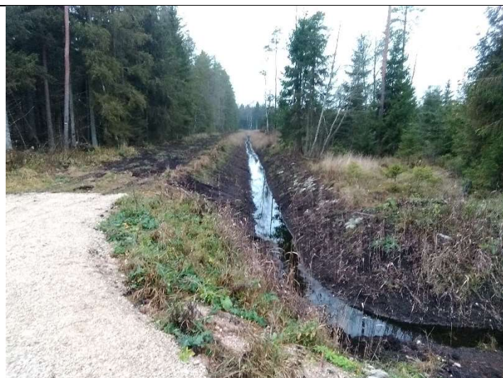
Foto 65. vaade vastu vee voolusuunda rekonstrueeritud kraavile 414