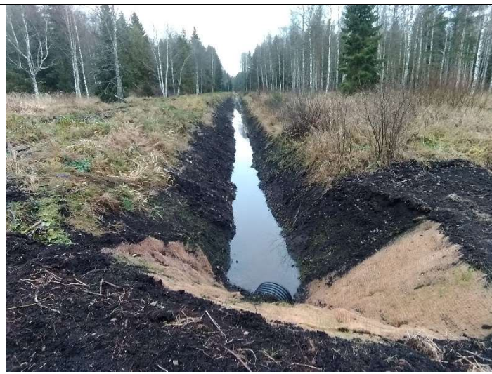
Foto 44. vaade rekonstrueeritud eesvoolu 200a voolusängile ja selle PK5 ja PK6 vahelisel lõigul rajatud veeviimari väljavoolu poolsele otsakule