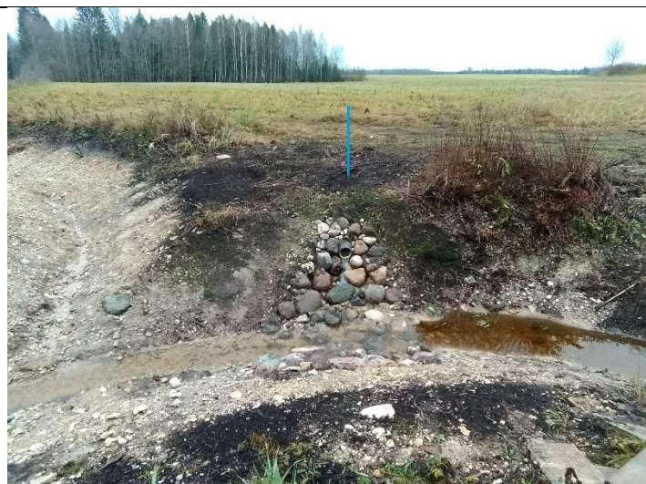
Foto 49. vaade eesvoolu 202a paremalt kaldalt suubuvale, rekonstrueeritud drenaažisuudmele D3 ja selle tähisele