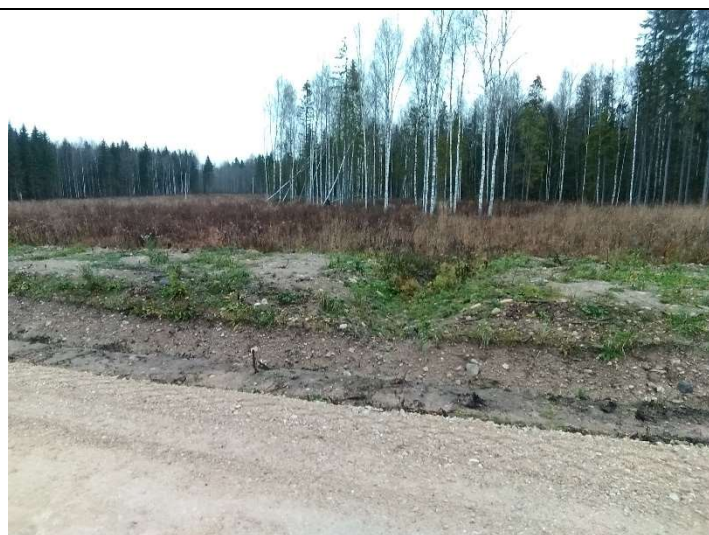
Foto 3. vaade Soemäe ringtee ääres voolunõva mullavalli taguse liigvee ärajuhtimiseks rajatud sissevoolunõvale