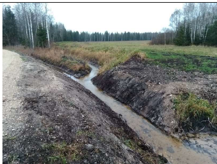
Foto 67. vaade vastu vee voolusuunda rekonstrueeritud eesvoolu 700 ja teekraavi 1006 ühenduskohale