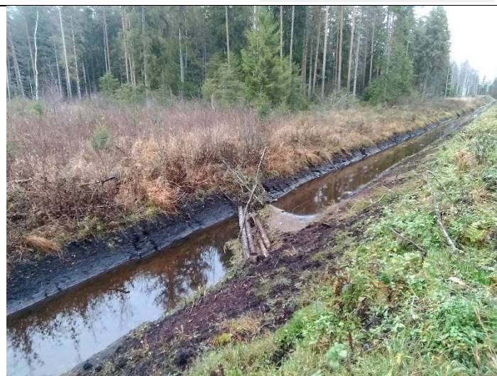
Foto 58. vaade rekonstrueeritud eesvoolu 200b voolusängis PK3 piirkonnas tekkinud ülepääsule, mis on voolutakistuseks