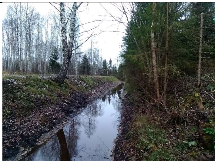
Foto 59. vaade rekonstrueeritud eesvoolu 200b, trassil settevalli laialiajamise asukoha muutus, töid tehti PK – PK paremal kaldal