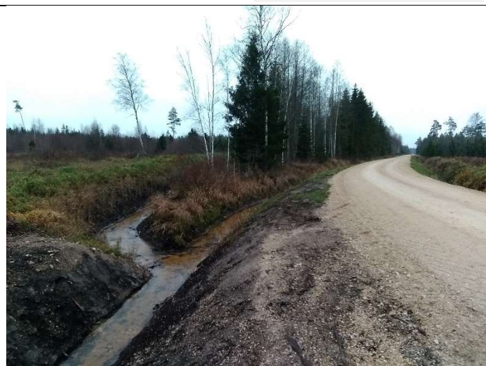
Foto 66. vaade vastu vee voolusuunas rekonstrueeritud eesvoolu 700 ja teekraavi 1004 ühenduskohale