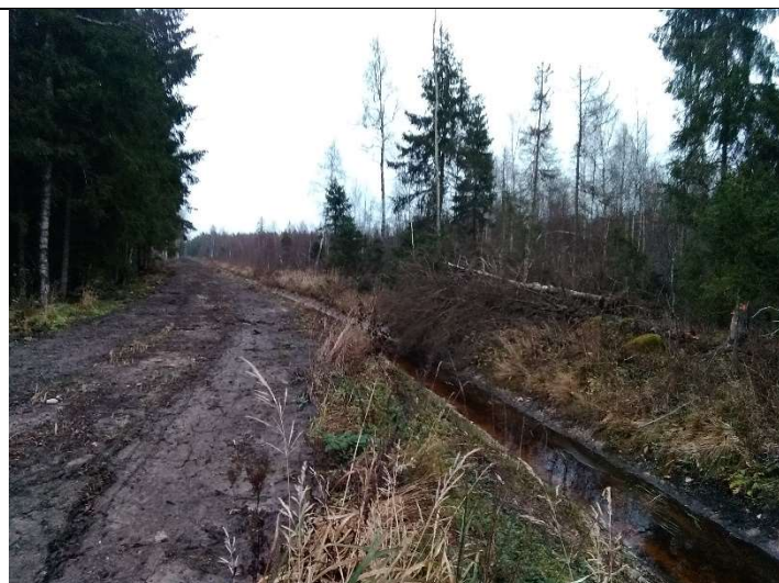
Foto 81. vaade vastu vee voolusuunda uuendatud eesvoolu 600d voolusängile ja trassil tasandatud muldele, vahetult enne selle suubumist eesvoolu 500