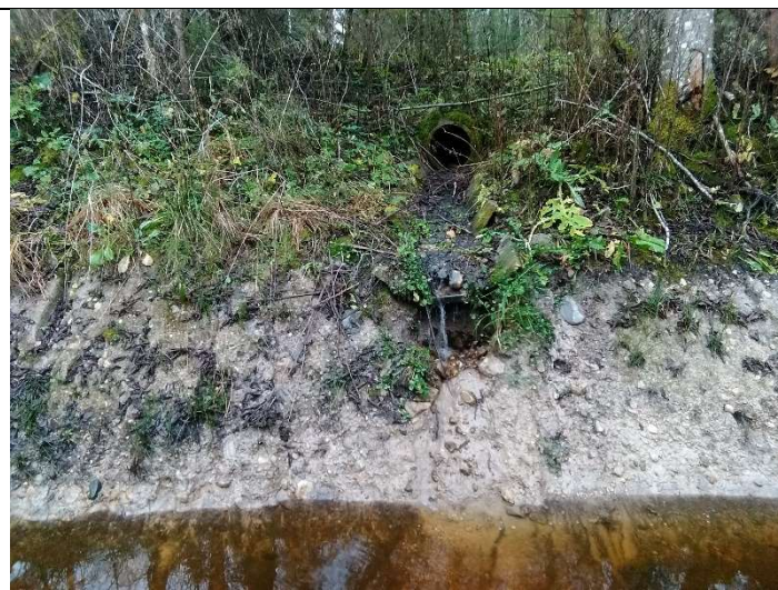
Foto 60. vaade kraavi sissevoolul murtav kolmikplaatidest kraavi ühendus ja olemasolevasse seisukorda jäetud truup T37