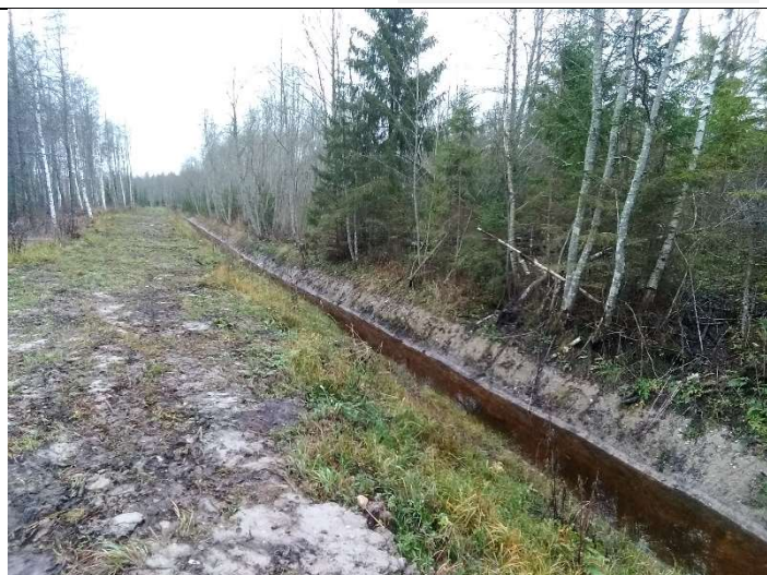
Foto 62. vaade vastu vee voolusuunda rekonstrueeritud eesvoolu 200b PK6 ja PK7 vahelisel lõigul voolusängile ja vasakul kaldal rajatud trassile