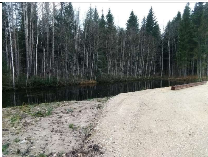
Foto 2. vaade rekonstrueeritud tuletõrjетиigile TT1, sellega külgnevale kruuskattega teenindusplatsile ja tõkkepoomile