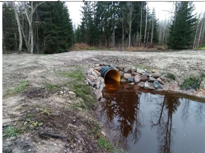
Foto 21. vaade eesvoolul 300 ehitatud uuele truubil T305