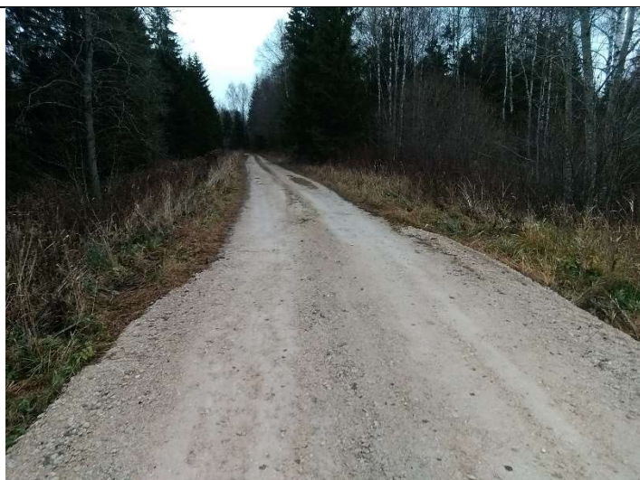
Foto 33. vaade rekonstrueeritud Soemäe ringtee lõigu lõpust, kus on tehtud kruuskatendi sujuv üleminek eramaal olemasolevasse olukorda jääva Soemäe rinttee lõigule