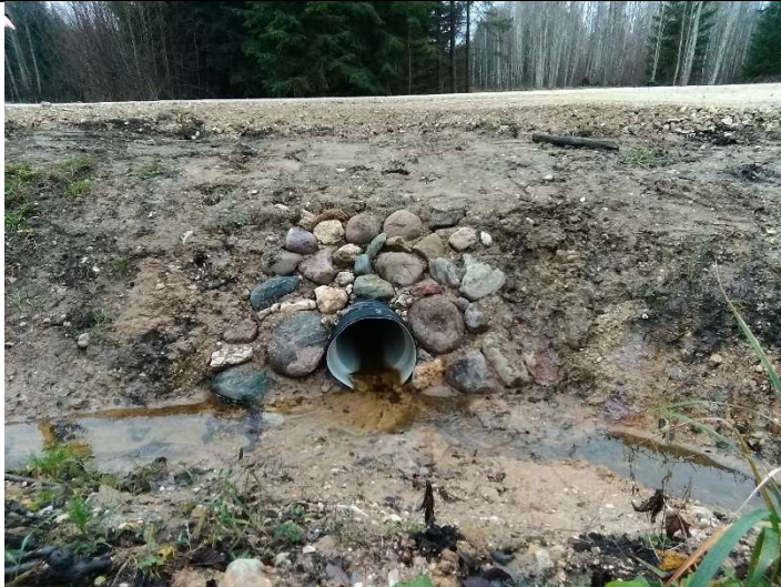
Foto 9. vaade rekonstrueeritud truubi T2 sissevoolu kividega kindlustatud otsakule