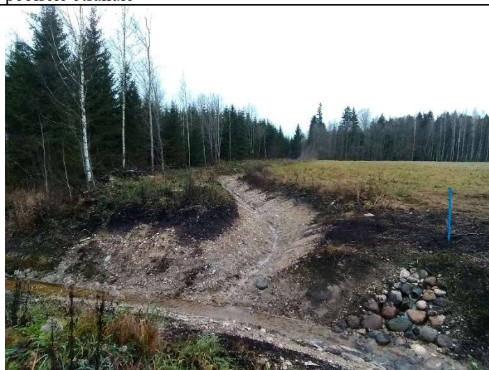
Foto 48. vaade eesvoolu 202a paremalt kaldalt suubuvale rekonstrueeritud kraavile 202 ja drenaažisuudmele D3