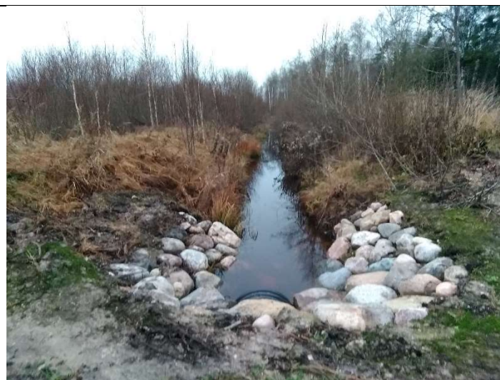
Foto 84. vaade vee voolusuunas hooldatud eesvoolu 500 voolusängile, ehitatud uue truubi T507 väljavoolul kividega kindlustatud otsakult