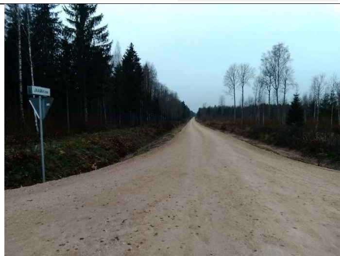
Foto 74. vaade ehitatud Jaama tee algusest kruuskatendile, liiklusemärgile ja tee nimetusega tahvlile ning rekonstrueeritud teekraavile 1201 (vasakul) ja ehitatud uuele teekraavile 1202 (paremal)