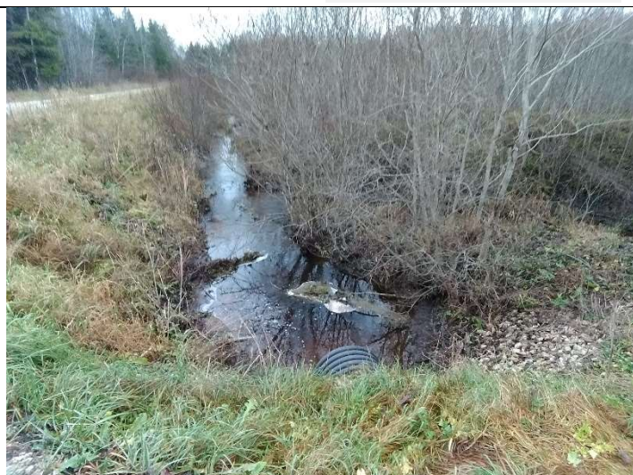
Foto 34. vaade olemasolevase seisukorda jäänud eesvoolul paikneva 14146 Vägeva-Pedja kõrvalmaantee truubi väljavoolu ava poolt