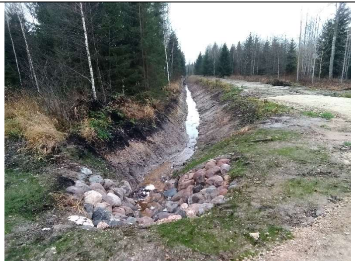
Foto 12. vaade rekonstrueeritud kraavi 303 voolusängile ja truubi T3 sissevoolul kividega kindlustatud otsakule