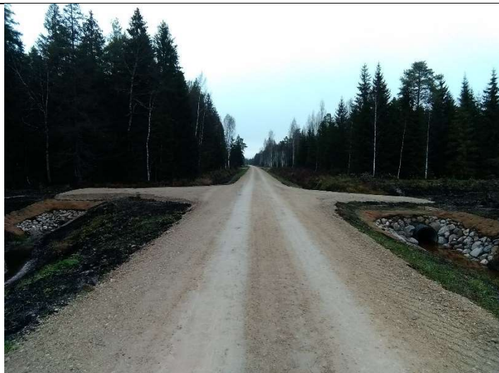
Foto 53. vaade rekonstrueeritud Lasinurme teele PK 14, ehitatud truupidele T1002 ja T1003 ning mahasõidukohtadele