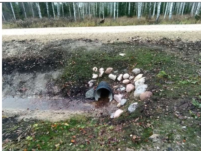
Foto 25. vaade Soemäe ringtee teekraavist 1105a liigvee suunamiseks eesvoolu 100 ehitatud uue truubi T1104 sissevoolu kividega kindlustatud otsakule