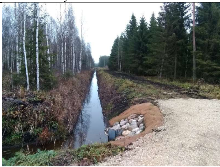
Foto 64. vaade rekonstrueeritud kraavile 408, rekonstrueeritud truubi T16 sissevoolu otsaku poolt