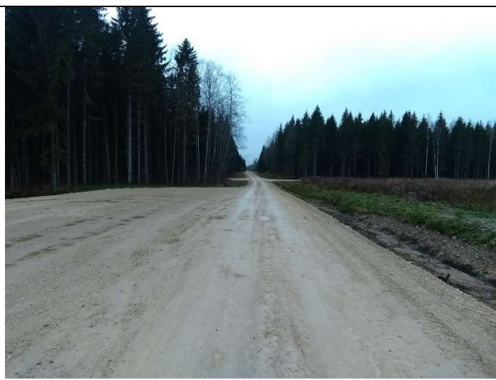
Foto 4. vaade rekonstrueeritud Soemäe ringtee ja tuletõrjетиigi TT1 teenindusplatsi kruuskatendile