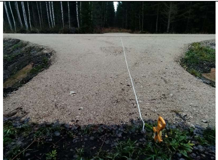
Foto 8. vaade rekonstrueeritud mahasõidukohale, tüüp M3, truubi T1 asukohas, sh mõõtmispunktile