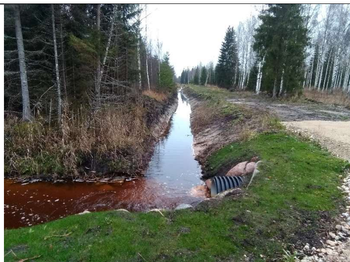
Foto 19. vaade vastu vee voolusuunda rekonstrueeritud kraavile 305, truubi T6 väljavoolu juurest