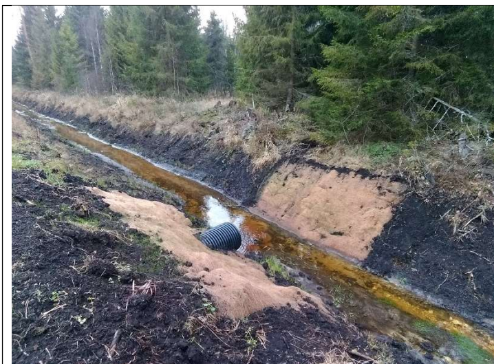
Foto 45. vaade rekonstrueeritud eesvoolule 200a rekonstrueeritud truubi T35 erosioonitõkke matiga kindlustatud otsakule