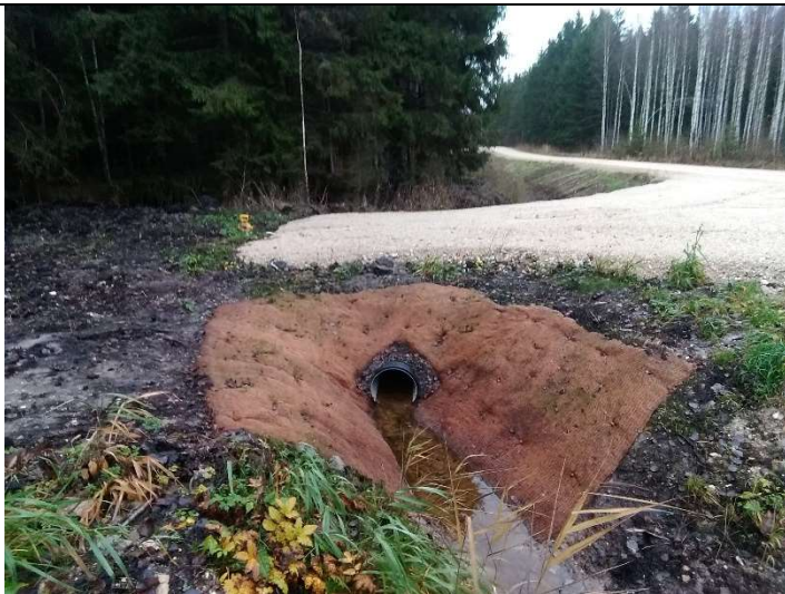
Foto 7. vaade rekonstrueeritud truubi T1 väljavoolu erosioonitõkkematiga kindlustatud otsakule