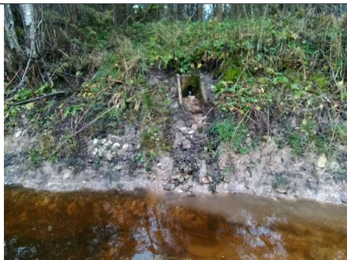
Foto 61. vaade korrastatud drenaažisuudmele D4