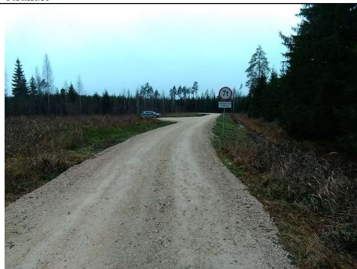
Foto 32. vaade rekonstrueeritud Soemäe ringtee lõpus PK 21 teekatendile ja rasketehnika massipiirangut tähistavale liiklusmärgile