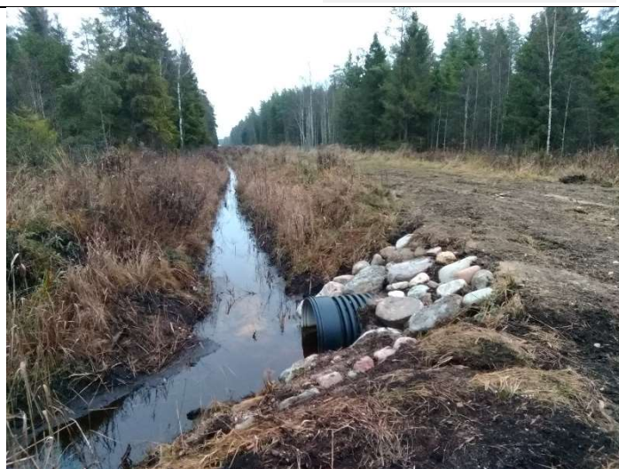
Foto 78. vaade uuendatud eesvoolu 600a ja rekonstrueeritud truubi T31 kividega kindlustatud sissevoolu otsakule