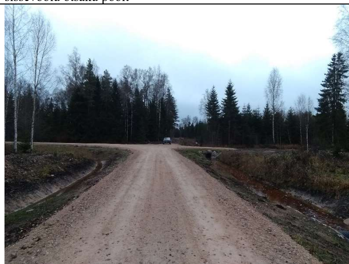
Foto 24. vaade rekonstrueeritud Soemäe ringtee kruuskatendile ja sellega külgnevatele teekraavidele 1105 ja 1105a ning eesvoolule 100, truubi T110