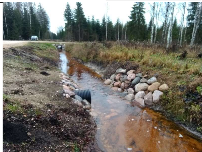
Foto 26. vaade vee voolusuunas rekonstrueeritud eesvoolu 100 voolusängile ja uue ehitatud truubi T1104 väljavoolul kividega kindlustatud otsakule ja veejuhtme vastaskalda poolse nõlvale