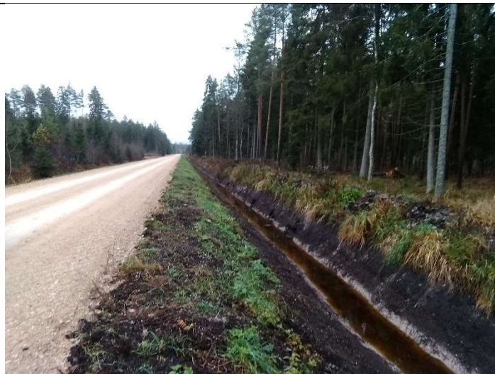
Foto 54. vaade Lasinurme tee PK14 külgnevale rekonstrueeritud teekraavile 1001