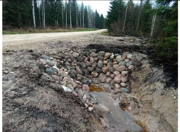
Foto 10. vaade rekonstrueeritud truubi T2 väljavoolu poolsele kividega kindlustatud otsakule