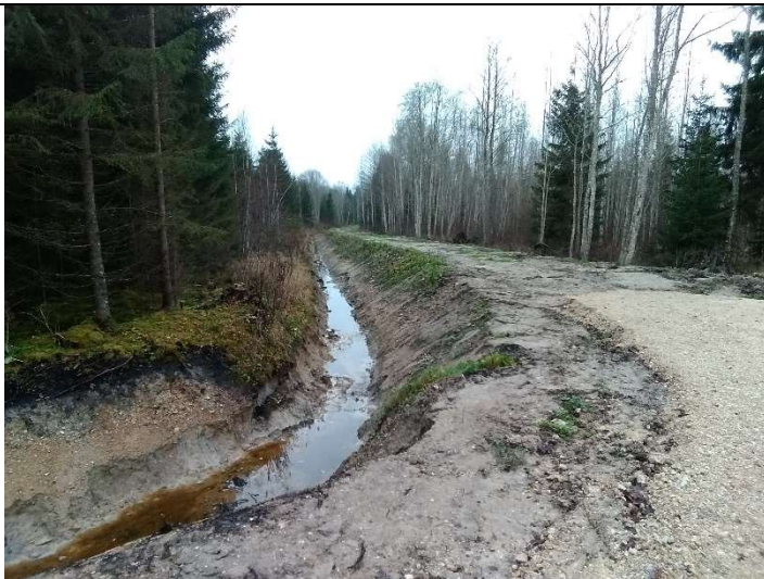
Foto 11. vaade rekonstrueeritud truubist T2 allavoolu rekonstrueeritud kraavi 302 voolusängile