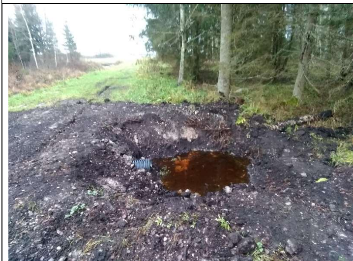
Foto 47. vaade eesvoolu 200a PK 5 ja PK 6 vahelisel lõigul mullavalli alusele veeviimari sissevoolu ava esisel alal settesüvendile