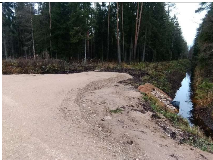
Foto 55. vaade rekonstrueeritud kraavile 415 ja mahasõidukohale, tüüp M3, truubi T1003 sissevoolu otsaku poolt