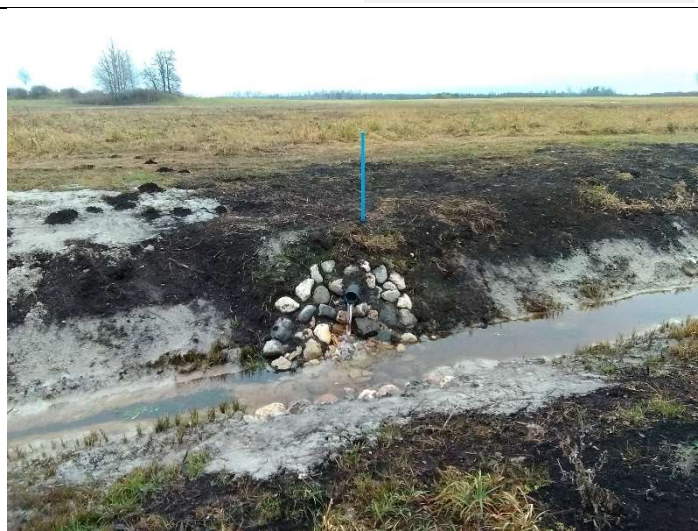
Foto 50. vaade eesvoolu 202a paremalt kaldalt suubuvale, rekonstrueeritud drenaažisuudmele D2 ja selle tähisele