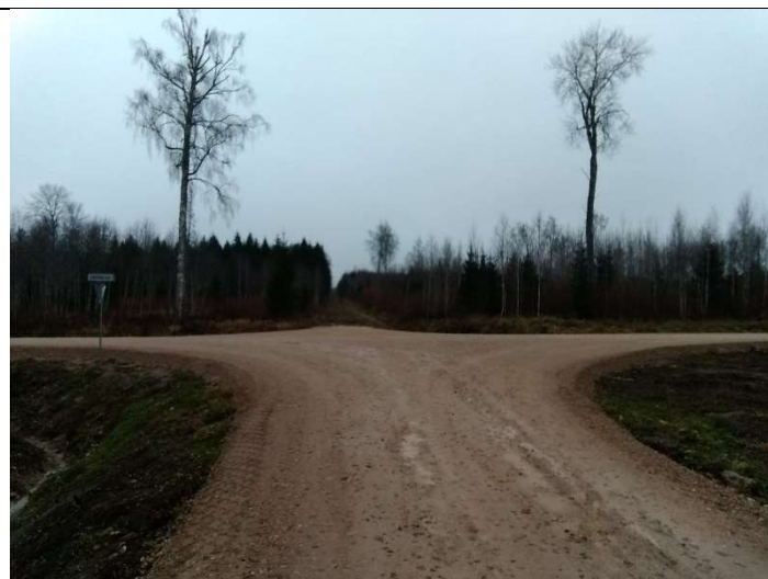
Foto 72. vaade rekonstrueeritud Lasnurme tee PK 34 ja ehitatud Jaama tee ristumiskohale