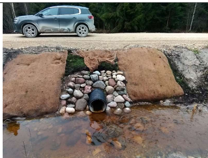
Foto 28. vaade rekonstrueeritud truubi T7 väljavoolu poolsele kivide ja erosioonitõkke matiga kindlustatud otsakule, kus on näha võimalik metsloomade poolt tekitatud kahjustus