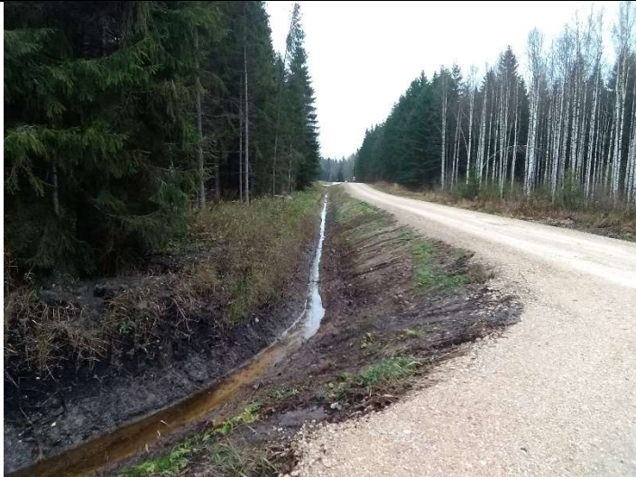
Foto 5. vaade rekonstrueeritud teekraavile 1101, vahetult enne rekonstrueeritud truupi T1