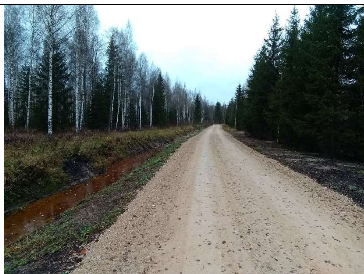
Foto 27. vaade rekonstrueeritud eesvooluga 100 külgnevale ja Soemäe ringtee kruuskatendile Pk 12 ja PK13 vahel, truubi T1104 asukohas