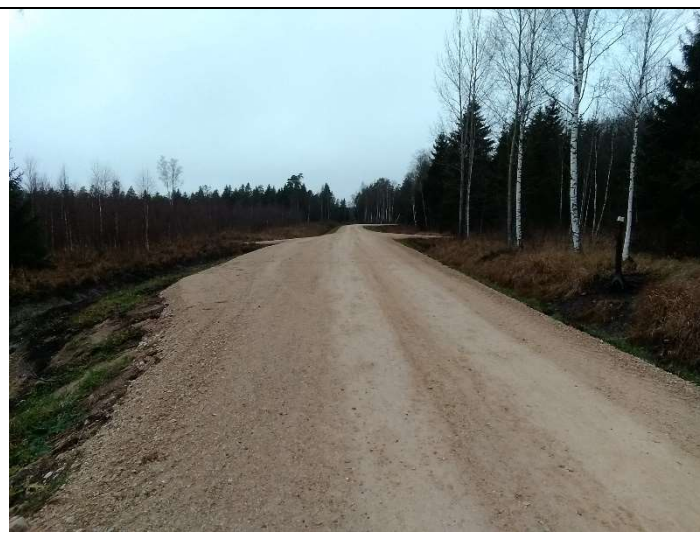
Foto 68. vaade rekonstrueeritud Lasinurme teel PK 22 ja PK 23 vahelisel lõigul rajatud möödasõidukohale